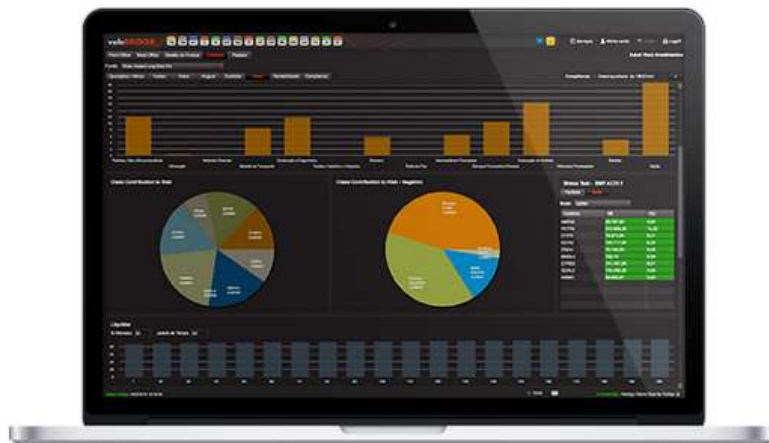
Imagem do Módulo de Risco da plataforma Valebroker